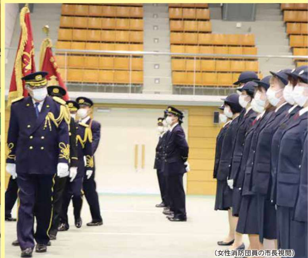
(女性消防団員の市長視閲)