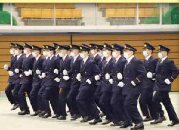
(消防職員の隊列移動)