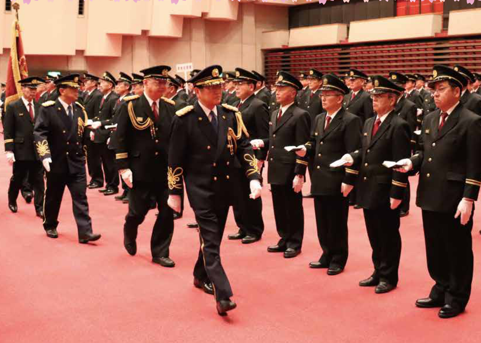
表紙写真:令和7年1月11日(土)に行われた、「令和7年福井市長消防年頭視閲」の様子です。